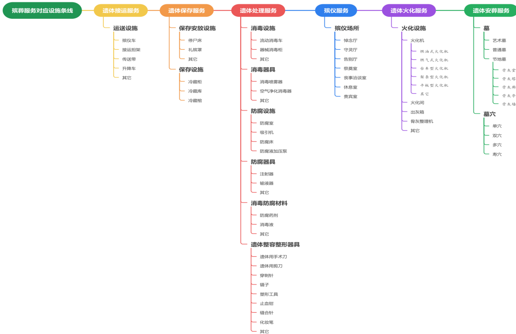
图 2 殡葬设施条线