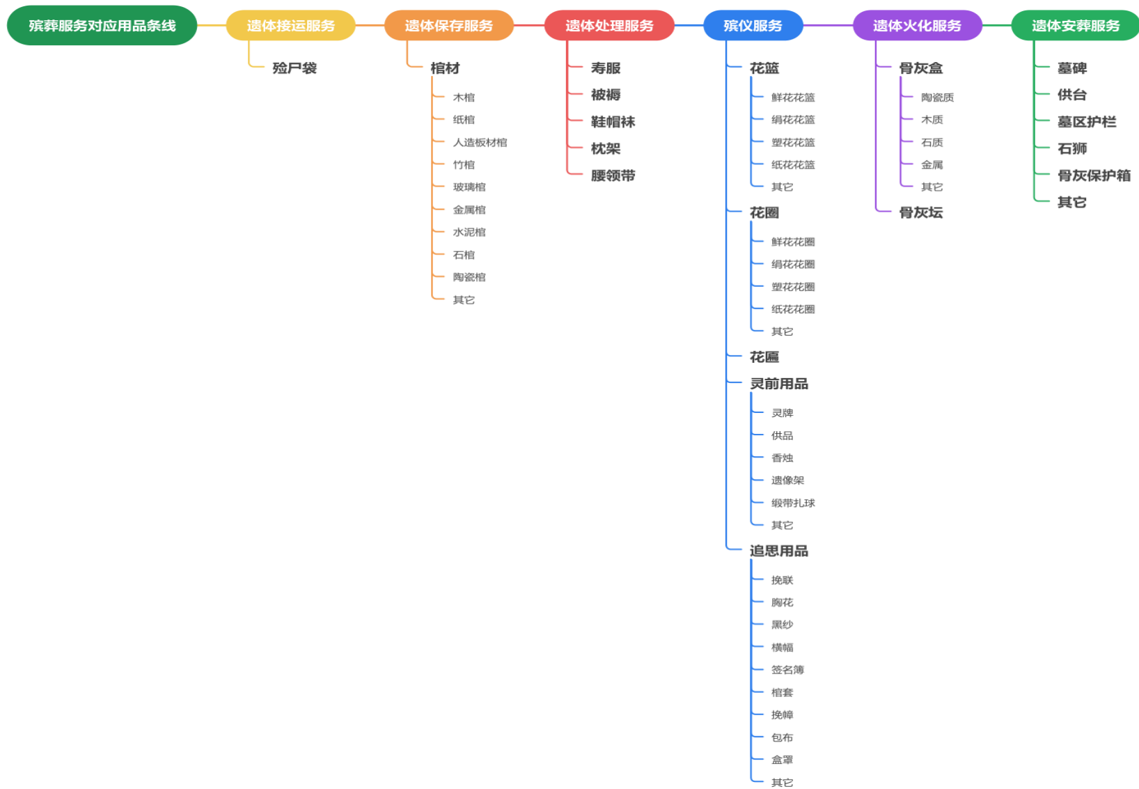
图 3 殡葬用品条线